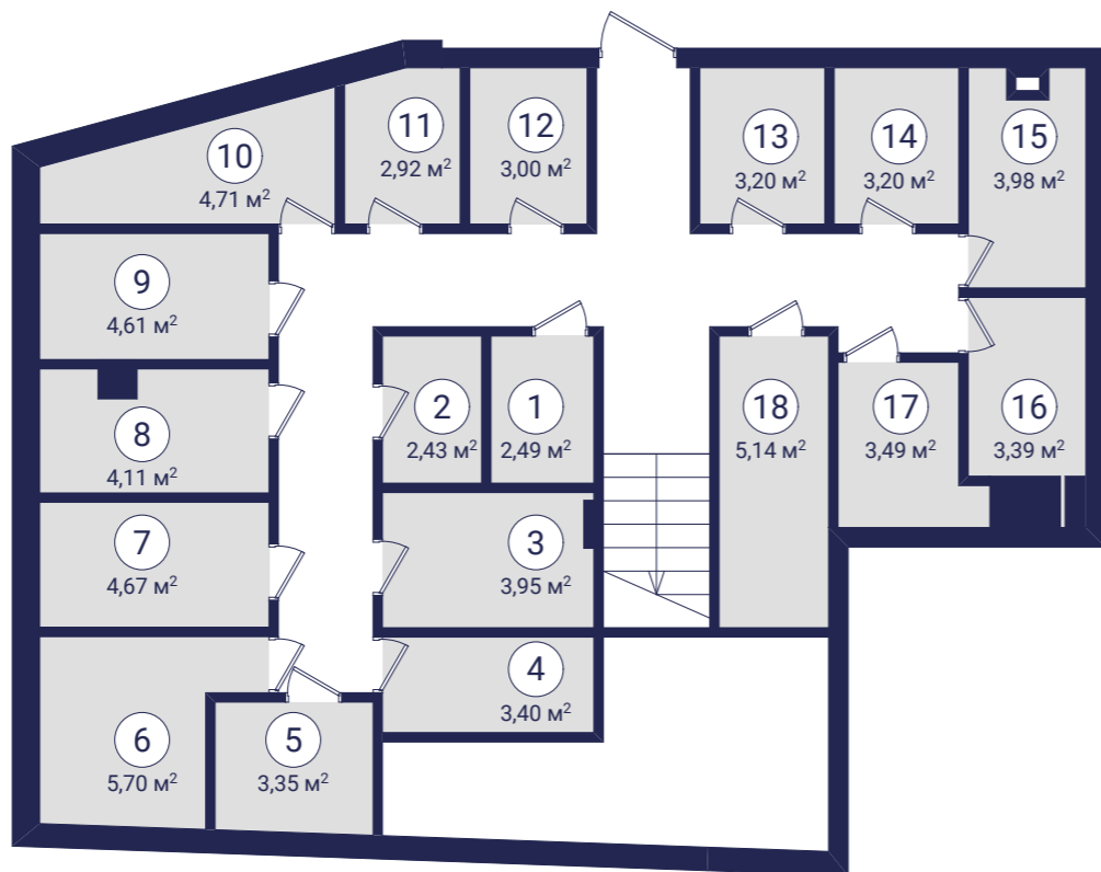
Житловий будинок Планування комор 1 поверху